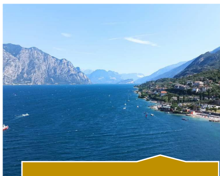
Lac de Garde