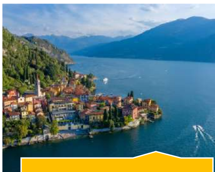
Lac de côme