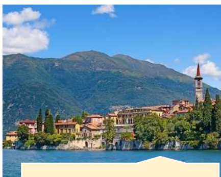
Lac de Lugano